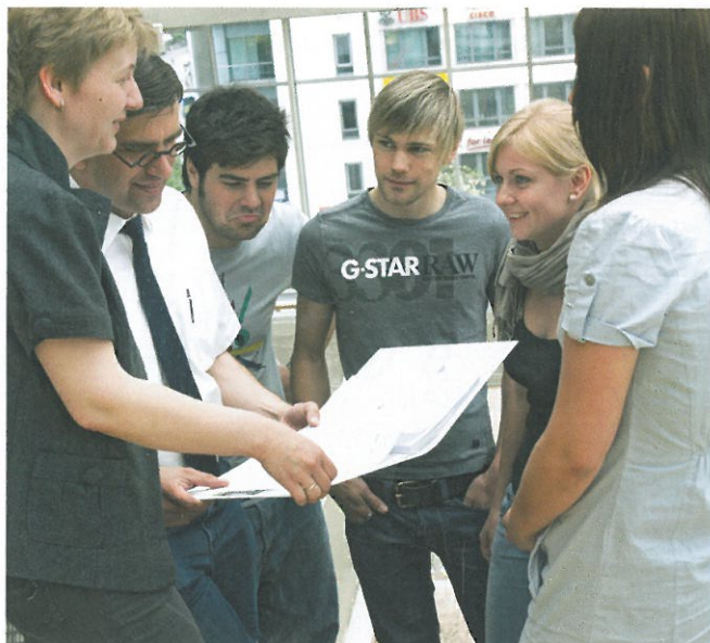
In einer Gruppe lernt es sich oft leichter, das gilt auch für Lerntechniken

Lohnt sich der ganze Aufwand? Vielleicht ist es wie mit dem Autofahren. Auch ohne Führerschein kommt man irgendwie von A nach B. Warum sollte man den ganzen Aufwand treiben: Theorie büffeln, unzählige Fragebögen ausfüllen, Theorieprüfung machen. Dann die Fahrstunden mit Einparken, Wenden in drei Zügen und Anfahren am Berg, blöde Kommentare vom Fahrlehrer und dann noch mal 'ne Prüfung. Warum der ganze Aufwand, wo ich doch auch den Bus nehmen oder laufen könnte? Wer den Führerschein dann hat und die Unabhängigkeit, die Schnelligkeit spürt, für den ist diese Frage recht schnell beantwortet mit: „Oh ja, dieser Aufwand lohnt sich!“ Wer einmal ein Merkwortsystem gelernt hat und erlebt, wie schnell und dauerhaft man sich Zahlen merken kann, der möchte es auch nicht wieder missen.